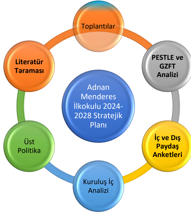
Şekil 1: Stratejik Plan Hazırlık Aşamaları

Başarılı bir stratejik planlamanın önemli adımları arasında plan hazırlık çalışmalarının belli bir sistematik yapı içerisinde yürütülmesi ve hazırlık sürecinde katılımcılığın yüksek düzeyde olması ile ekip çalışmasının sağlıklı bir şekilde gerçekleşmesi yer almaktadır. Hazırlık dönemindeki çalışmalar, Mardin İl Millî Eğitim Müdürlüğü tarafından yayımlanan Millî Eğitim Bakanlığı 2024-2028 Stratejik Plan Hazırlık Programı'nda detaylı olarak ele alınmış ve okulumuz stratejik plan hazırlığında bu program rehberliğinde ilerlenmiştir.